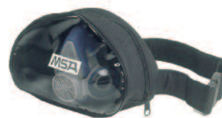
Tok az Advantage 200 LS-hez