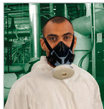
Advantage 410 P3 PlexTec szűrővel

A szabványos menetes szűrőkkel kapcsolatos részletes információért tanulmányozza a 05-100.2. prospektust.