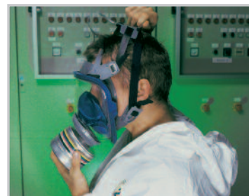
Húzza át a fejpántot a feje felett