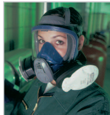
Advantage 3200 TabTec és FLEXIfilter szűrőkkel

Mind a háromféle szűrő választéka az Advantage 3200, az Advantage 200 LS és az Advantage 420 modellekkel is használható.