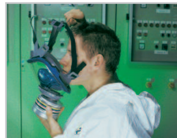
Illessze az állát a belső álarcba