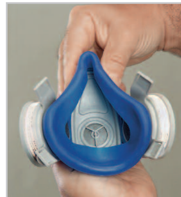
Félálc-arc illeszkedés Anthrocurve

Az Advantage 200 LS kényelmes, hatásos és gazdaságos félálc. Ideális olyan alkalmazásokhoz, ahol a dolgozók különféle munkahelyi kockázatoknak vannak kitéve, például magas füstgáz-koncentráció, ködök és gázok.