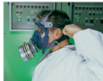
Szorítsa meg a két alsó pántot

Az Advantage 3000 teljesálarc sorozat védelmet és páratlan kényelmet nyújt. A hipoallergén szilikonból készült puha belső álarc nyomásmentes illeszkedést biztosít. A nagy, optikailag korrigált lencsék tiszta, tökéletes látást tesznek lehetővé, míg a szürke-kék szín esztétikus megjelenést kölcsönöz az álarcnak.