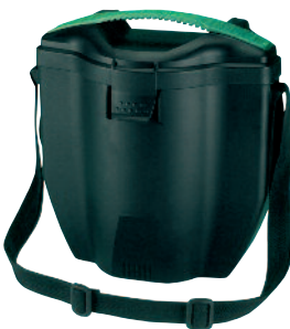
Advantage 3000 tartó

Az egyszerűes szűrő tömege nem haladhatja meg a 300 g-ot az Advantage 410 használatakor